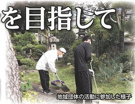
地域団体の活動に参加した様子

広島市社協では、「地域共生社会」の実現に向け様々な課題を抱える方への包括的な支援体制を構築する取組を地域の皆さんと一緒にしています。