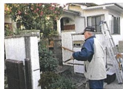
生活支援訪問サービスの活動中の様子

令和4年度の総合事業実施団体を、次の①～③のとおり募集します。詳しくは、問合せ先又は各区社会福祉協議会までお願いします。