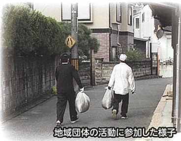
地域団体の活動に参加した様子

広島市社協では、「地域共生社会」の実現に向け様々な課題を抱える方への包括的な支援体制を構築する取組を地域の皆さんと一緒にしています。