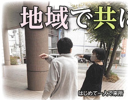
はじめて一人で来所