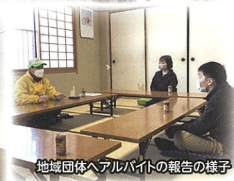
地域団体へアルバイトの報告の様子

今回は広島市くらしサポートセンター（以下くらしサポ）に相談に来られた方が、地域団体と一緒に活動することで社会参加・就労訓練につながった事例を紹介します。